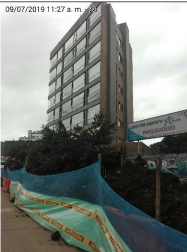
Foto 1. Vista panorámica del predio donde se encontraba instalado el elemento en la Carrera 16 No. 98-31