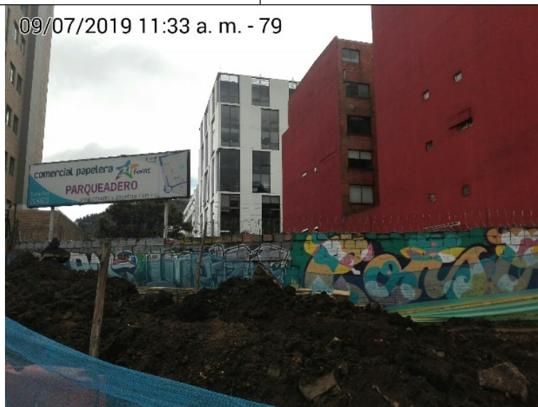
Foto 3. Vista panorámica del predio contiguo, donde será trasladado e instalado el elemento en la Carrera 16 No. 98-05 (Dirección Catastral), orientación Sur -Norte.